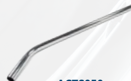
ACTS050 Varita de extensión encorvada cromada Ø50