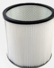
FI370305 per BL375TUV Filtro de cartucho Ø370