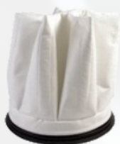
FA046P6 per BL375TU Filtro poliéster Ø460