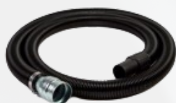
ACTF385VN Manguera flexible completa 5m Ø40