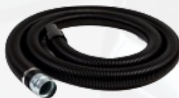
ACTF50C5VN Manguera flexible completa 5m Ø50