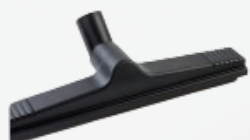
ACCS40050DAV Cuerpo de boquilla Ø50