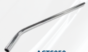
ACTS050 Varita de extensión encorvada cromada Ø50