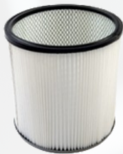
FI250260HL Filtro de cartucho Ø250