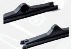
ACIP400 Boquilla deslizante para pisos Ø40