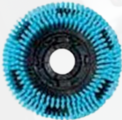
CPSP161703 Cepillo suave PP 0,3 mm