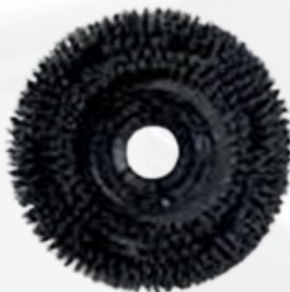
CPSP161712 Cepillo duro