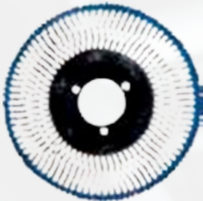
CPSP1617 Cepillo de polipropileno PP 0,3mm