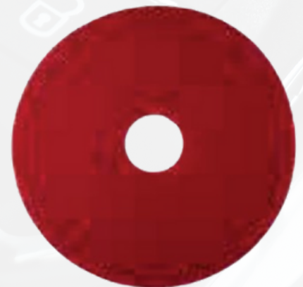
CPDM016R Disco rojo de microfibra