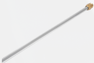
Lanza de alta presión