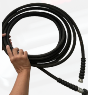
Manguera de alta presión